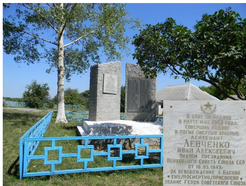
Памятный знак установлен в селе Басово Золочевского района Харьковской области (Украина)