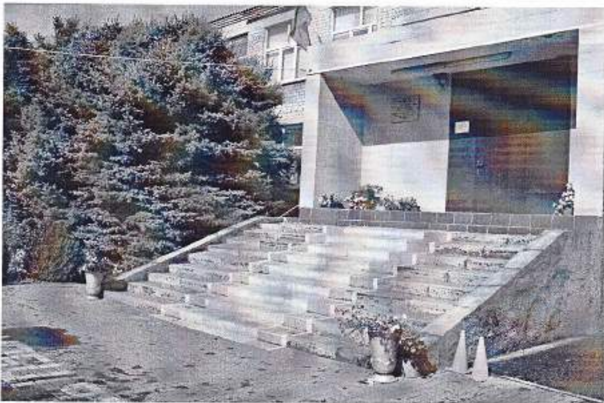
Зоны целевого назначения