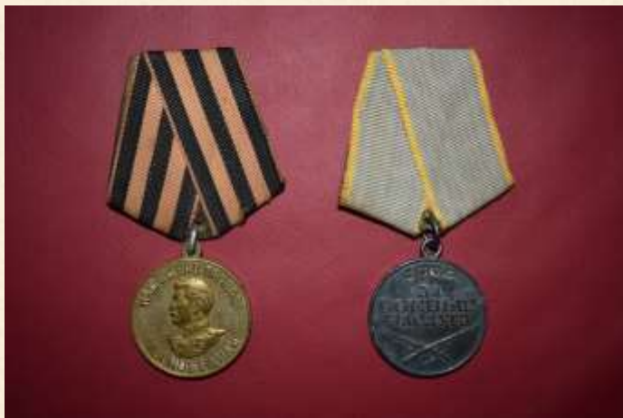
Медаль «За боевые заслуги»