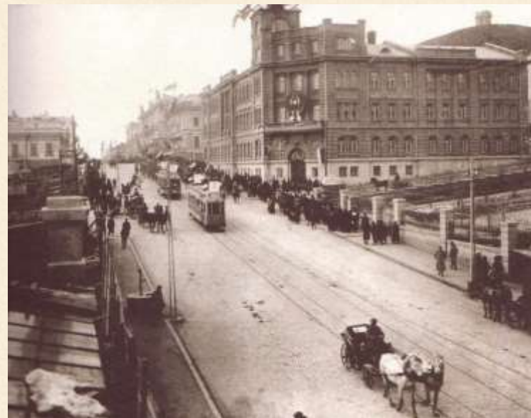
На фото: г. Владивосток летом 1909 г.