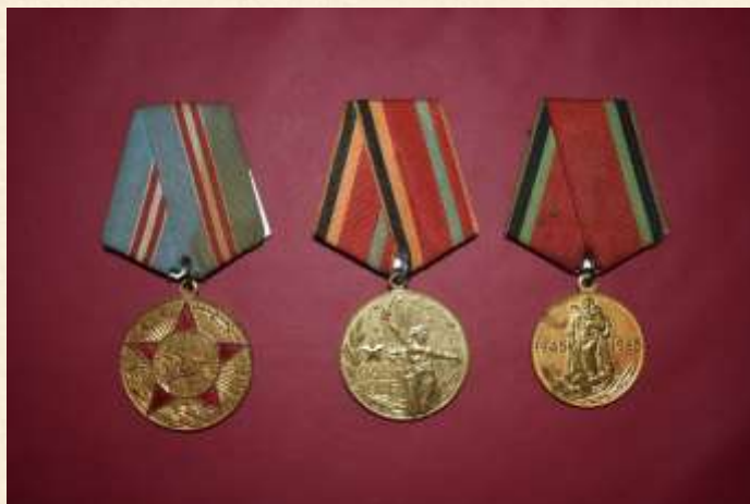
Юбилейная медаль «День Победы 1945 - 1985»